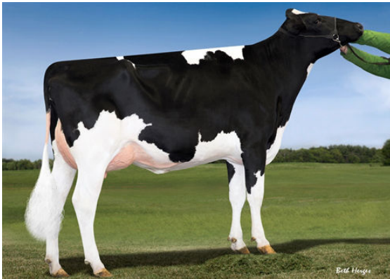
FARNEAR-TBR-BH GEORGIA THIRD DAM