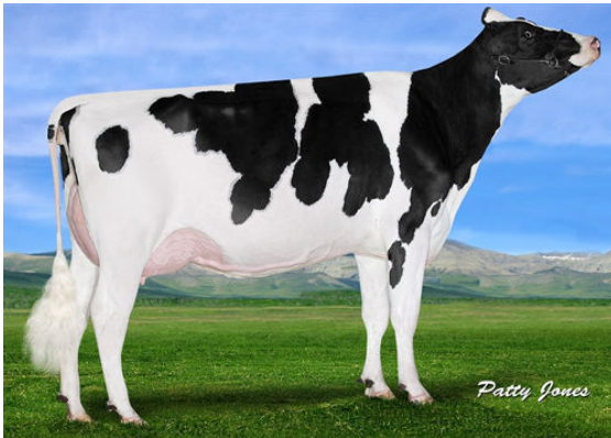
IHG JACEY GRACE GRANDDAM